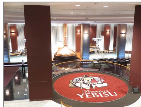
エビスビール記念館は、エビスビールの歴史や楽しみ方が分ると大人気

社名：サッポロビール株式会社 http://www.sapporobeer.jp/ 創業：2003年（平成15年）7月 本社：〒150-8522 東京都渋谷区恵比寿四丁目20番1号（恵比寿ガーデンプレイス内） 事業内容：ビール・発泡酒・その他の酒類の製造・販売、ワイン・洋酒の販売、他