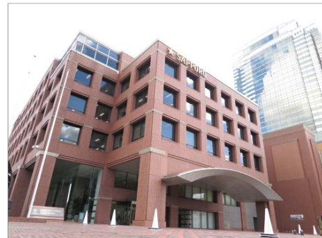
サッポロビール本社ビル