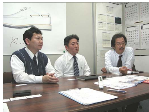
システム部の皆さん。「Web版の導入は、現場にも喜ばれています。」