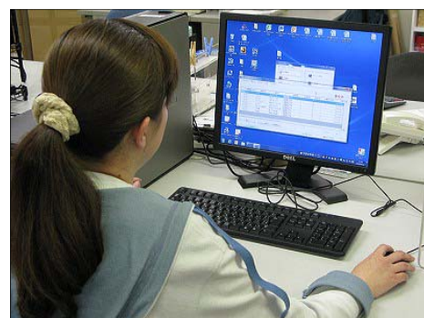
「EOS名人」は同社の受注業務に欠かせない。