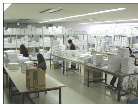
サンエースさまの商品を出荷する様子。