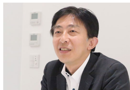
「『何かあったとき』に備えるため、業務の自動化に取り組みました」