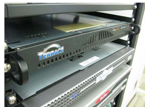
当社導入のスパム・ウィルス・フィッシング対策アプライアンスサーバ「SPAM WATCHER」。おかげでスパムメールが激減しました。

All Rights Reserved. Copyright© USAC SYSTEM Co., LTD.