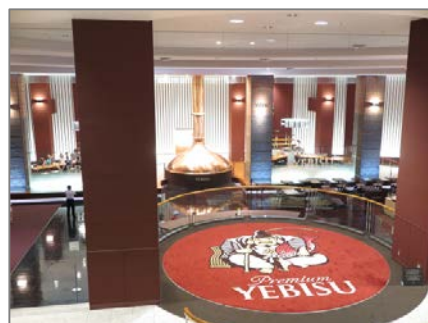
エビスビール記念館は、エビスビールの歴史や楽しみ方が分かったと大人気