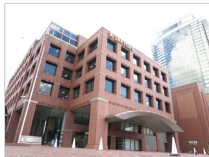
サッポロビール本社ビル