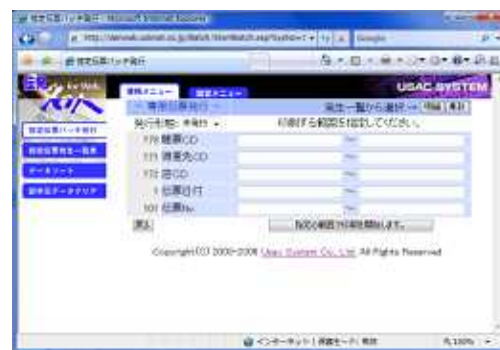
「伝発名人 for Web」の画面。クライアントはブラウザのみで良い。 サンプル画像