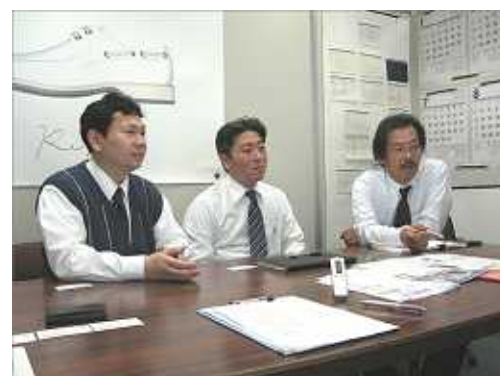
システム部の皆さん。「Web版の導入は、現場にも喜ばれています。」