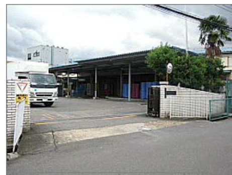
恩地食品本社工場。最新設備の導入や衛生管理にも力を入れている。

All Rights Reserved. Copyright© USAC SYSTEM Co., LTD.